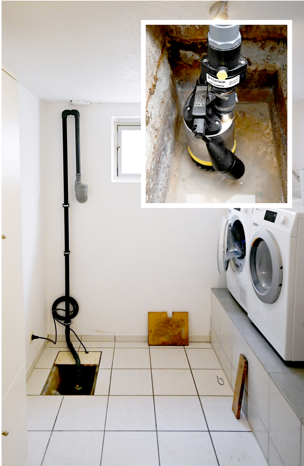
Bild 2: MultiDrain UV3 S Schmutzwasserpumpe für die Entwässerung eines Waschkellers