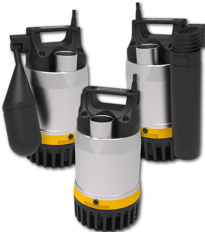
Bild 1: Die neuen MultiDrain UV3 Schmutzwasserpumpen für den häuslichen Bereich: UV3 S mit Schwimmerschalter (links), UV3 SF mit Niveausteuern für enge Schächte (rechts) und UV3 für den mobilen Einsatz (Mitte). Robust, langlebig, VDE-zertifiziert.

Ansprechpartner Presse im Unternehmen: Jung Pumpen GmbH Dr.-Ing. Andreas Kämpf Industriestraße 4-6 33803 Steinhagen Telefon +49 5204 17-320 andreas.kaempf@pentair.com