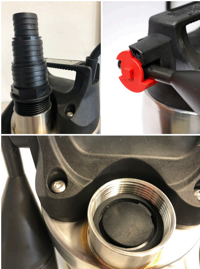
Bild 4: Umfangreiches Zubehör der UV3 ermöglichen einen sofortigen mobilen Einsatz der Pumpe z.B. zum Entwässern eines gefluteten Kellers.