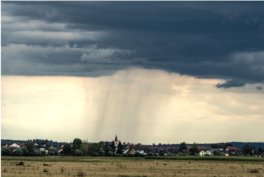
Bild 1: Starkregen kommt oft unerwartet und ergießt sich punktuell