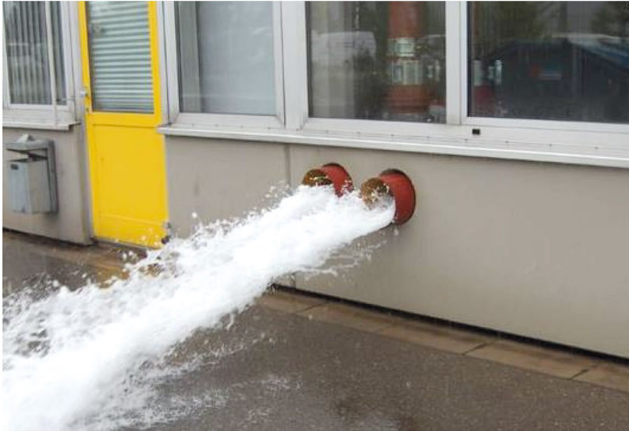
Bild 3: Notentwässerung eines großen Hallendaches während eines Starkregenereignisses